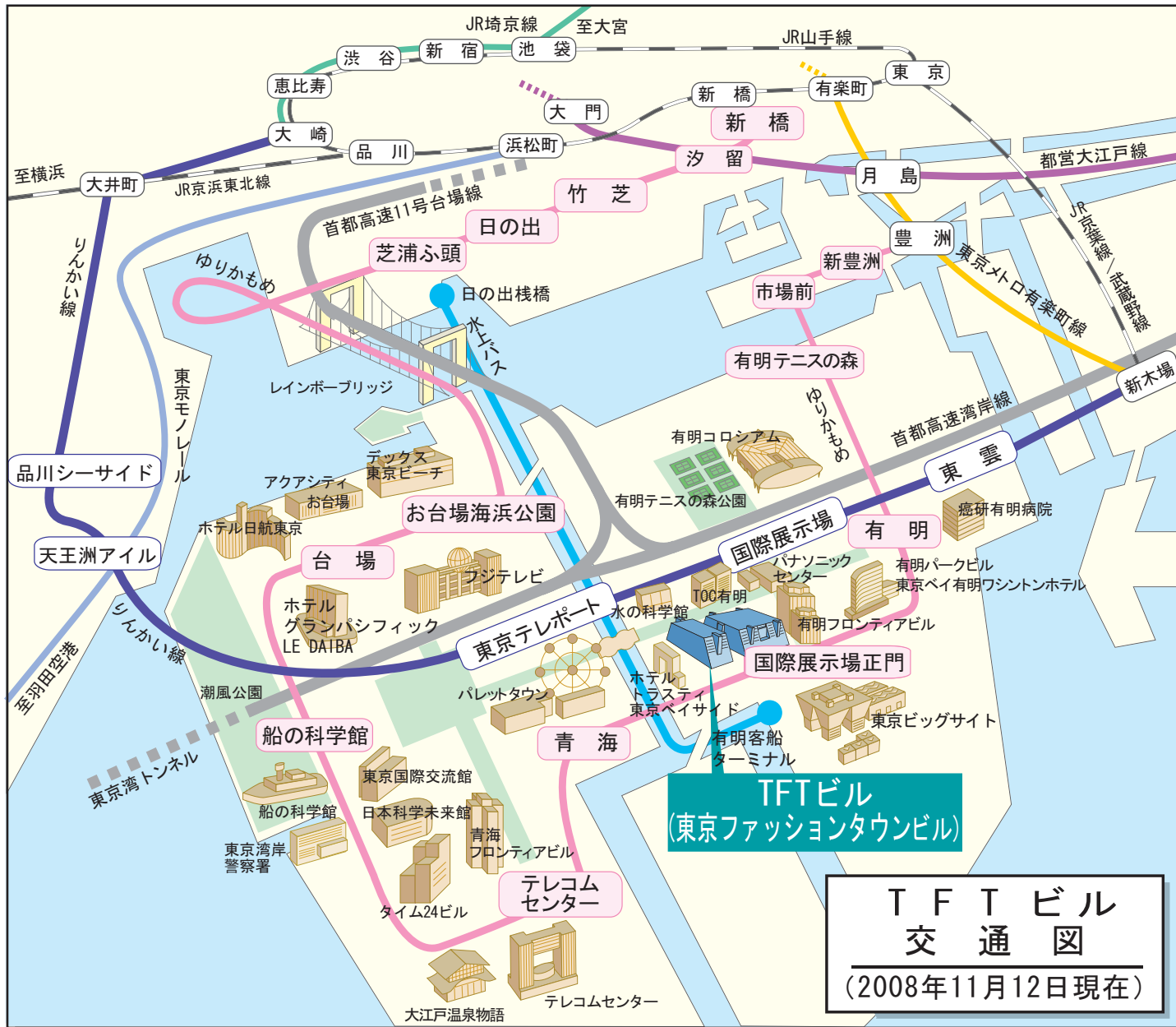
TFTビル 交通図 (2008年11月12日現在)