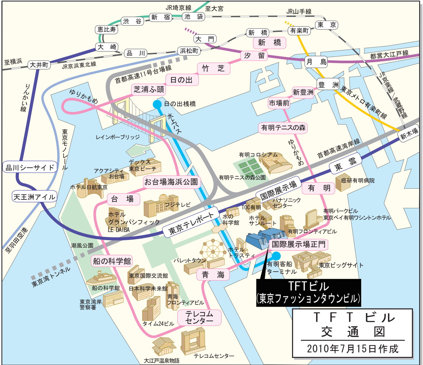
TFTビル 交通図 2010年7月15日作成